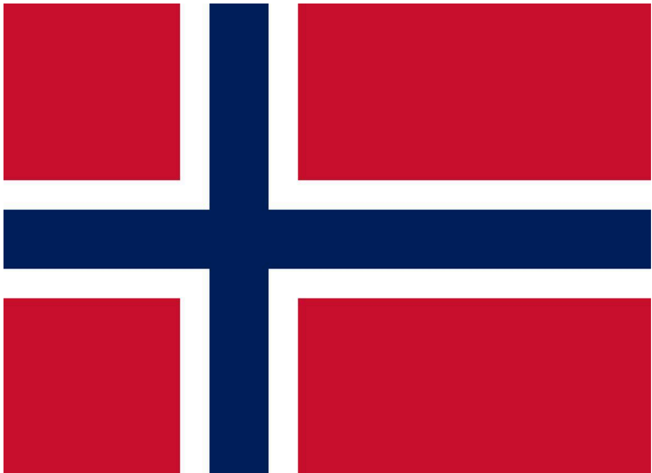
Det norske flagget